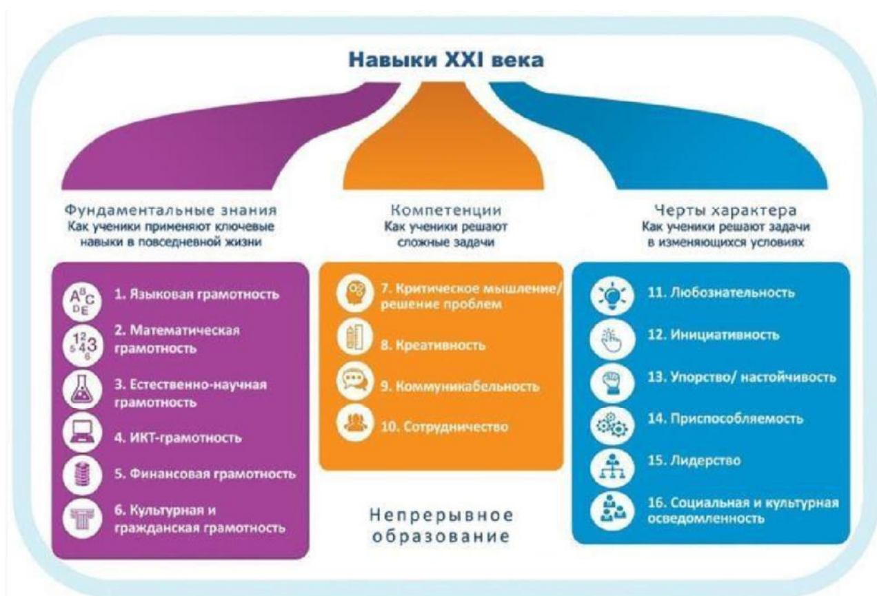
Рисунок 1. Образовательная модель World Economic Forum

С целью решения этой проблемы проектной группой Всемирного экономического форума была разработана и представлена в докладе «Новый взгляд на образование» модель, включающая в себя три типа образовательного результата: знания предметных областей с акцентом на функциональные грамотности, включая ИКТ-грамотность, компетенции 4К и качества характера.