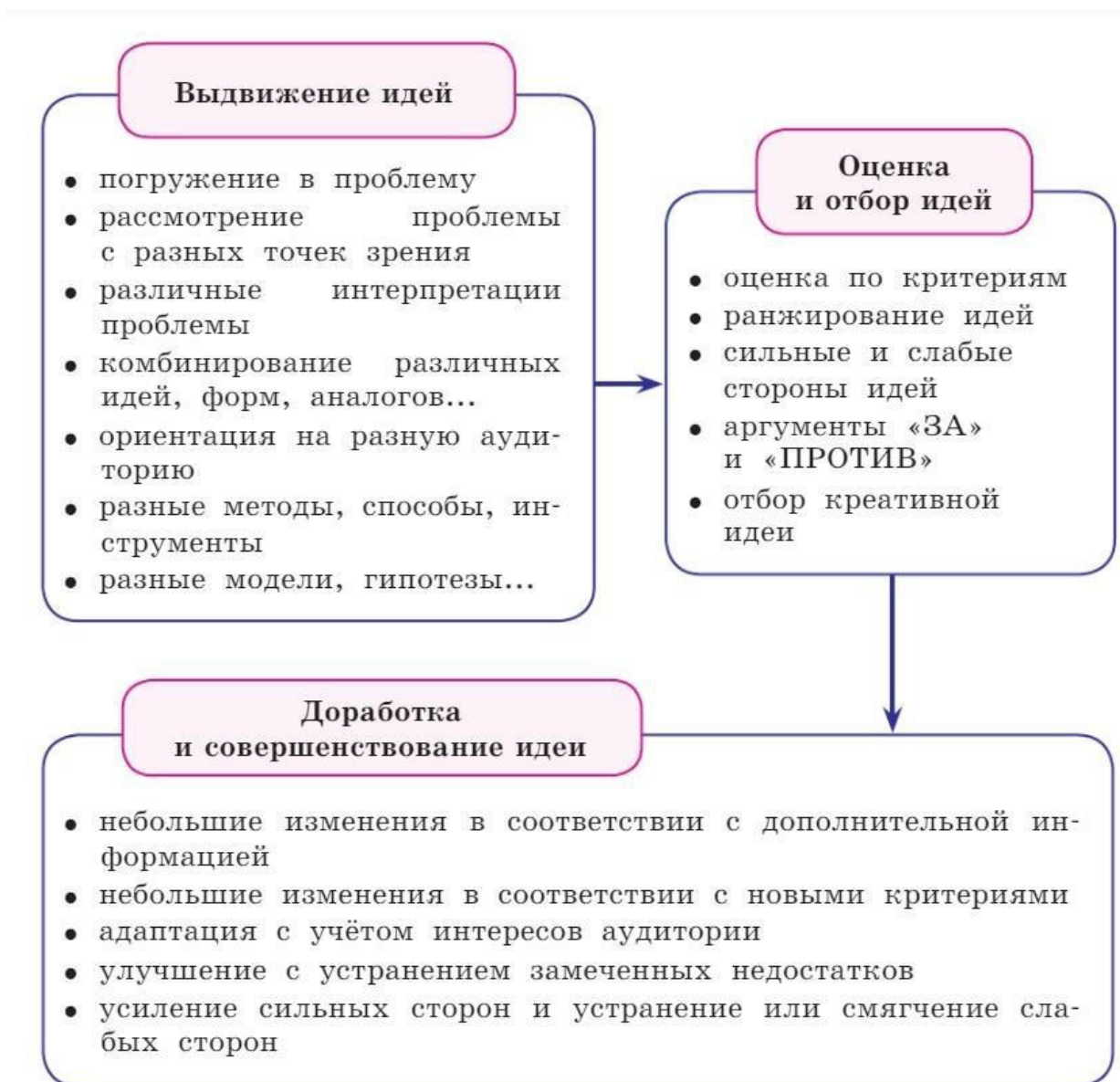
Рисунок 2. Действия, требуемые при выполнении заданий на креативность

Алгоритм работы с учебной ситуацией или учебной задачей описан Г.С. Ковалёвой, О.Б. Логиновой и др. в учебном пособии для общеобразовательных организаций «Креативное мышление. Сборник эталонных заданий» 1 и представлен на рисунке 2.